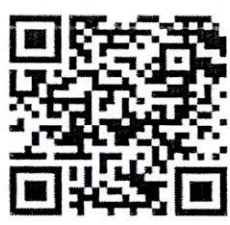
ສໍາລັບແບບຟອມສະໝັກ

ດັ່ງນັ້ນ, ຈຶ່ງແຈ້ງມາຍັງທ່ານເພື່ອຊາບ ແລະ ພິຈາລະນາຕາມທາງຄວນດ້ວຍ.